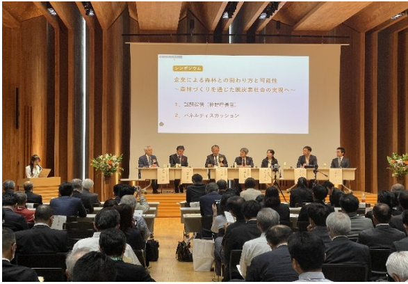
第3部 パネルディスカッションの様子

動力・実績に関する意見やアイデアなどが多々出され、会場参加された方々も興味津々といった雰囲気で大いに盛り上がったシンポジウムとなりました。